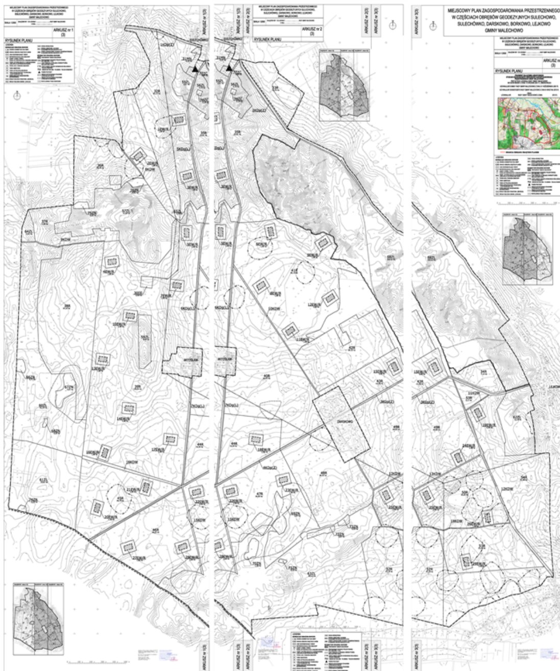
Załącznik nr 1 – ARKUSZ 1(3) Załącznik nr 1 – ARKUSZ 2(3) Załącznik nr 1 – ARKUSZ 3(3)