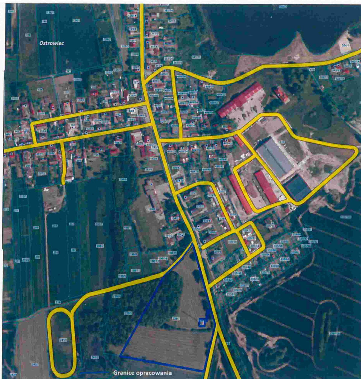
Ryc.2. Aktualny stan zagospodarowania obszaru opracowania - Ostrowiec