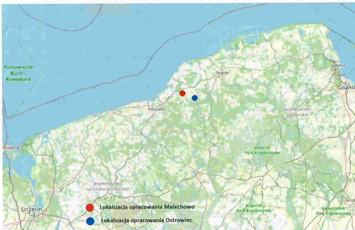
Ryc.1. Lokalizacja opracowania na tle województwa zachodniopomorskiego

Dla analizowanych terenów obowiązuje plan zagospodarowania przestrzennego uchwalony przez Radę Gminy Malechowo w 1996 roku ( uchwała Nr XIX/112/1996 z dnia 30 grudnia 1996 roku) oraz Studium uwarunkowań i kierunków zagospodarowania przestrzennego gminy Malechowo, uchwalone uchwałą nr XXVII/185/2001 z dnia 13 grudnia 2001r. i zmienione uchwałami Rady Gminy Malechowo: nr XI/98/07 z dnia 31 października 2007r., nr XXXIII/313/2010 z dnia 06 kwietnia 2010r., nr III/33/2010 z dnia 30 grudnia 2010r., nr XVI/122/2016 z dnia 25 lutego 2016r., nr XXX/249/2017 z dnia 31 sierpnia 2017r. oraz nr LVI/419/2023 z dnia 20 grudnia 2023 r., a także zmienionego Zarządzeniem Zastępczym Wojewody Zachodniopomorskiego nr 7/2018 z dnia 09 lipca 2018r. i nr 7/2022 z dnia 24 czerwca 2022 r. Ustalenia w/w studium są wiążące dla niniejszego opracowania planistycznego.