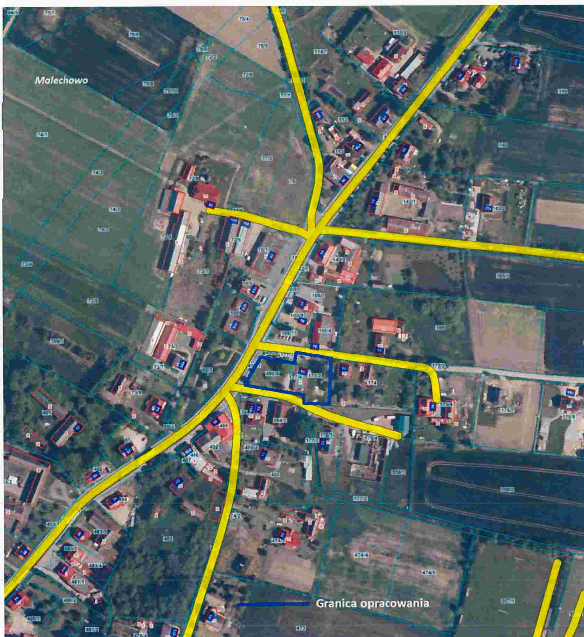
Ryc.2a. Aktualny stan zagospodarowania obszaru opracowania - Malechowo

Dla obszarów objętych planem opracowane zostały ogólne zagadnienia fizjograficzne w Opracowaniu ekofizjograficznym.