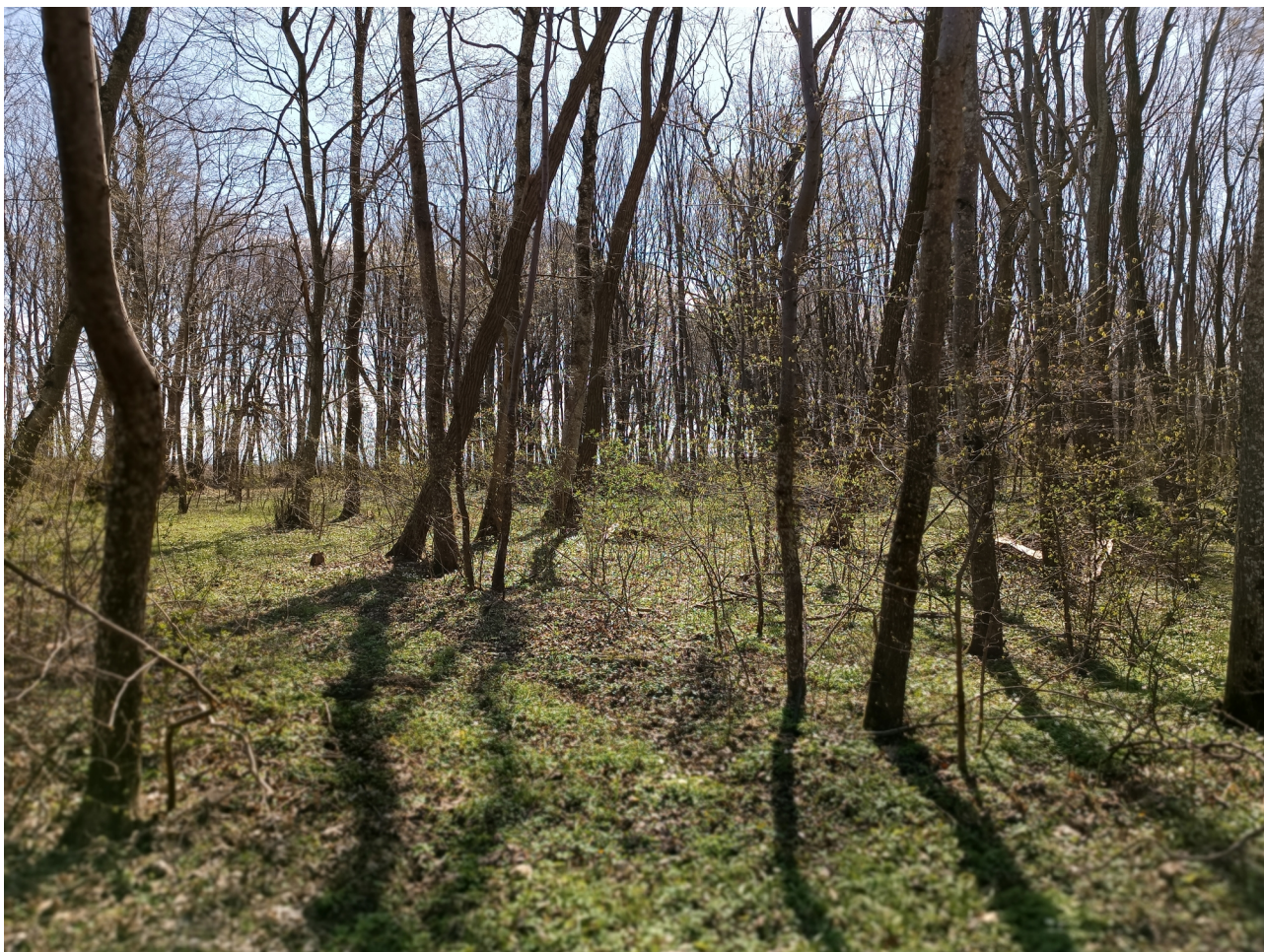
Park dworski w Żegocinie, stan na 22.04.2022.

Drugim niezwykle ważnym miejscem w Żegocinie jest zabytkowy park dworski. Na działkach nr 16/2 i 16/4 znajdują się wieloletnie drzewa i kwitnące kwiaty polne. Niestety miejsce jest zaniedbane i wymaga interwencji mieszkańców oraz środków finansowych by je odrestaurować lub nadać mu nową funkcję.