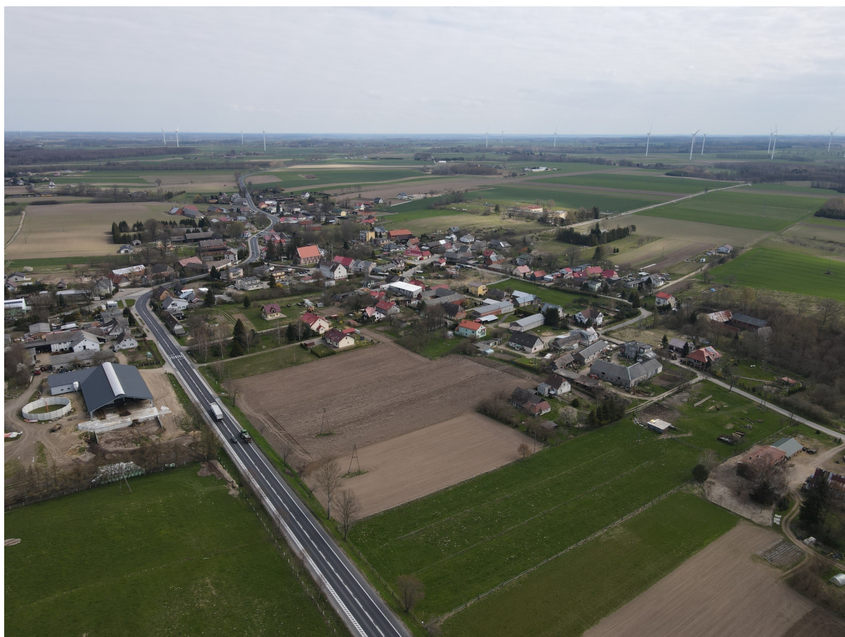
Widok na Malechowo, 28.04.2021.

oraz zabudowa gospodarcza z nieliczną zabudową budynków/bloków wielorodzinnych. W centralnej części wsi znajduje się kościół - murowany z czerwonej cegły, posadowiony na kamiennym fundamencie. Ponadto, w miejscowości przy DK nr 6 usytuowany jest park zwany „Sercem Wsi”, w którym znajdują się dwie wiaty rekreacyjne z ławostołami, wyłożona polbrukiem ścieżka, ławki parkowe oraz pojemniki na odpady. W Malechowie znaleźć można również: budynek Urzędu Gminy, Zakład Opieki Zdrowotnej, Zespół Szkolno-Przedszkolny, restauracje, sklepy, aptekę, siedzibę Ochotniczej Straży Pożarnej, kwaciarnię, bank, oraz siedzibę Gminnej Biblioteki Publicznej.