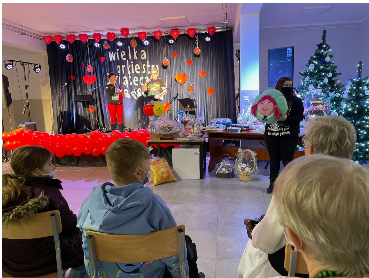
Finiał WOŚP w Gminie Malechowo, 30.01.2022.

Dla mieszkańców organizowane są bezpłatne zajęcia nauki gry na klarncie, saksofonie, trąbce, pianinie, perkusji, zajęcia szachowe, warcabowe, nauka języka angielskiego, rytmika i próby zespołowe orkiestry. Dzieci uczestniczą w odpłatnych zajęciach breakdance i akrobatyki. Seniorzy biorą udział w zajęciach ruchowych z wykwalifikowanym fizjoterapeutą. W ofercie dla dorosłych jest joga oraz zumba. Ponadto organizowane są projekcje filmów oraz malechowskie spotkania filmowe.