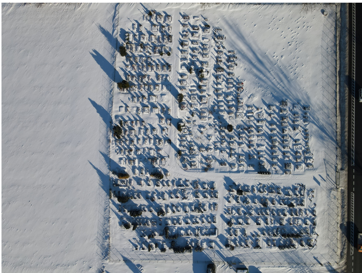
Cmentarz komunalny w Malechowie, 04.02.2022.

Cmentarz jest miejscem wyjątkowym. Stanowi świadectwo historyczne mieszkańców, których już nie ma. Ku pamięci kombatantów wojennych w pobliżu nekropolii ma powstać miejsce pamięci, będące symbolem niepodległości i wolności.