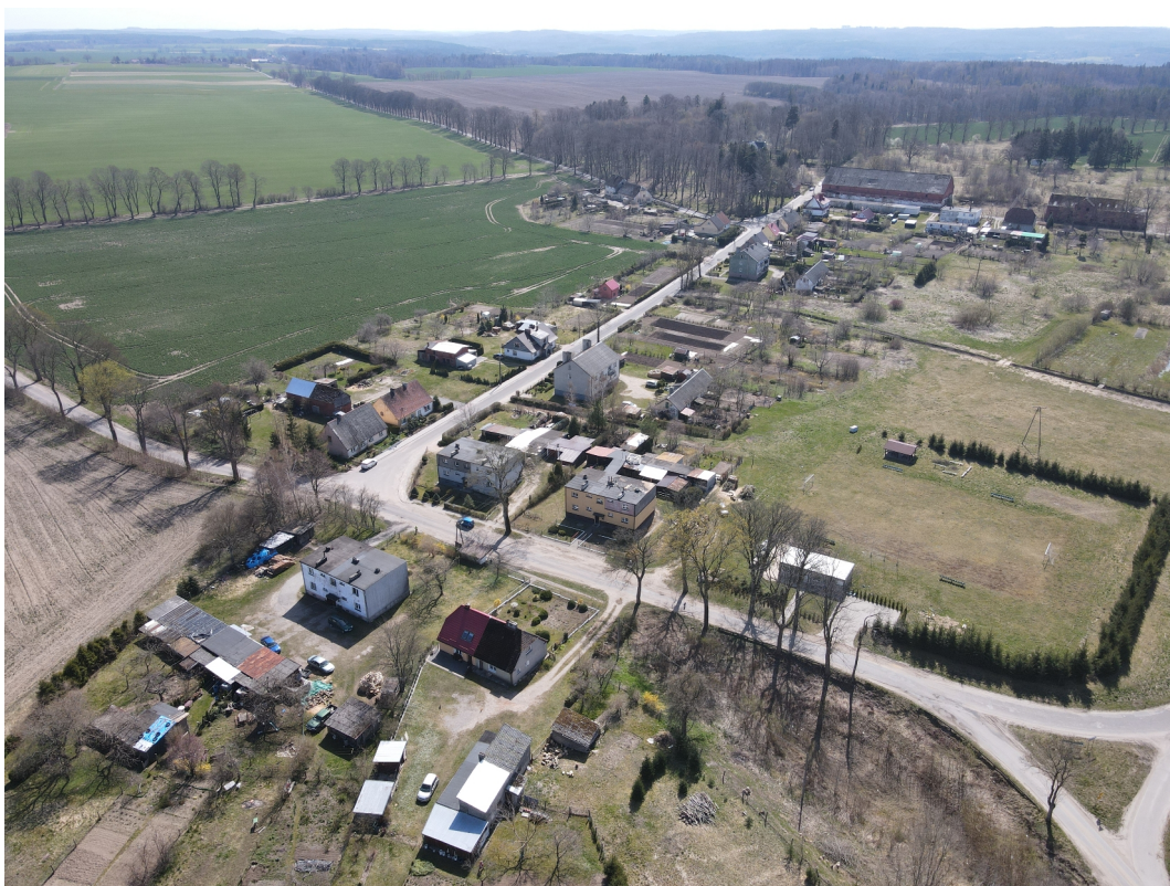
Po prawej stronie znajduje się teren rekreacyjny.

Na terenie sołectwa znajduje się kontenerowa świetlica wiejska z salą główną i aneksem kuchennym, w której odbywają się różnego rodzaju wydarzenia, spotkania z mieszkańcami oraz uroczystości. Ponadto mieszkańcy mogą cieszyć się z boiska do piłki nożnej, które służy również do organizacji przedsięwzięć plenerowych. W pobliżu postawiono wiatę integracyjną oraz stanowiska siłowni zewnętrznej. Strefa rekreacyjna jest bardzo zadbana, a otaczające ją drzewa gwarantują ciszę i spokój. W Żegocinie działa gospodarstwo agroturystyczne. W miejscowości brakuje placu zabaw dla dzieci oraz infrastruktury rowerowej.