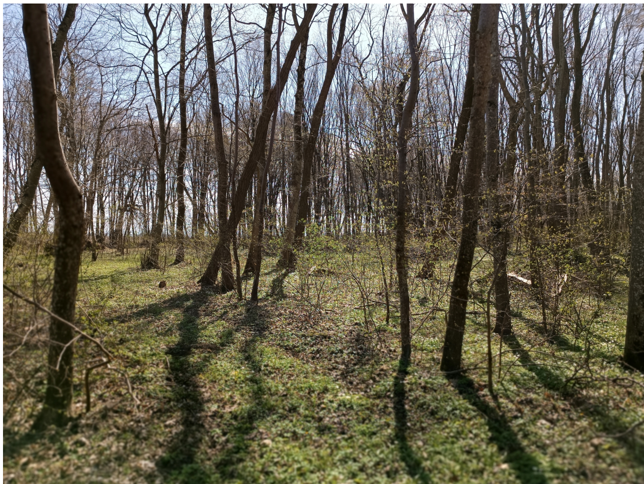
Park dworski w Żegocinie, stan na 22.04.2022.

Drugim niezwykle ważnym miejscem w Żegocinie jest zabytkowy park dworski. Na działkach nr 16/2 i 16/4 znajdują się wieloletnie drzewa i kwitnące kwiaty polne. Niestety miejsce jest zaniedbane i wymaga interwencji mieszkańców oraz środków finansowych by je odrestaurować lub nadać mu nową funkcję.