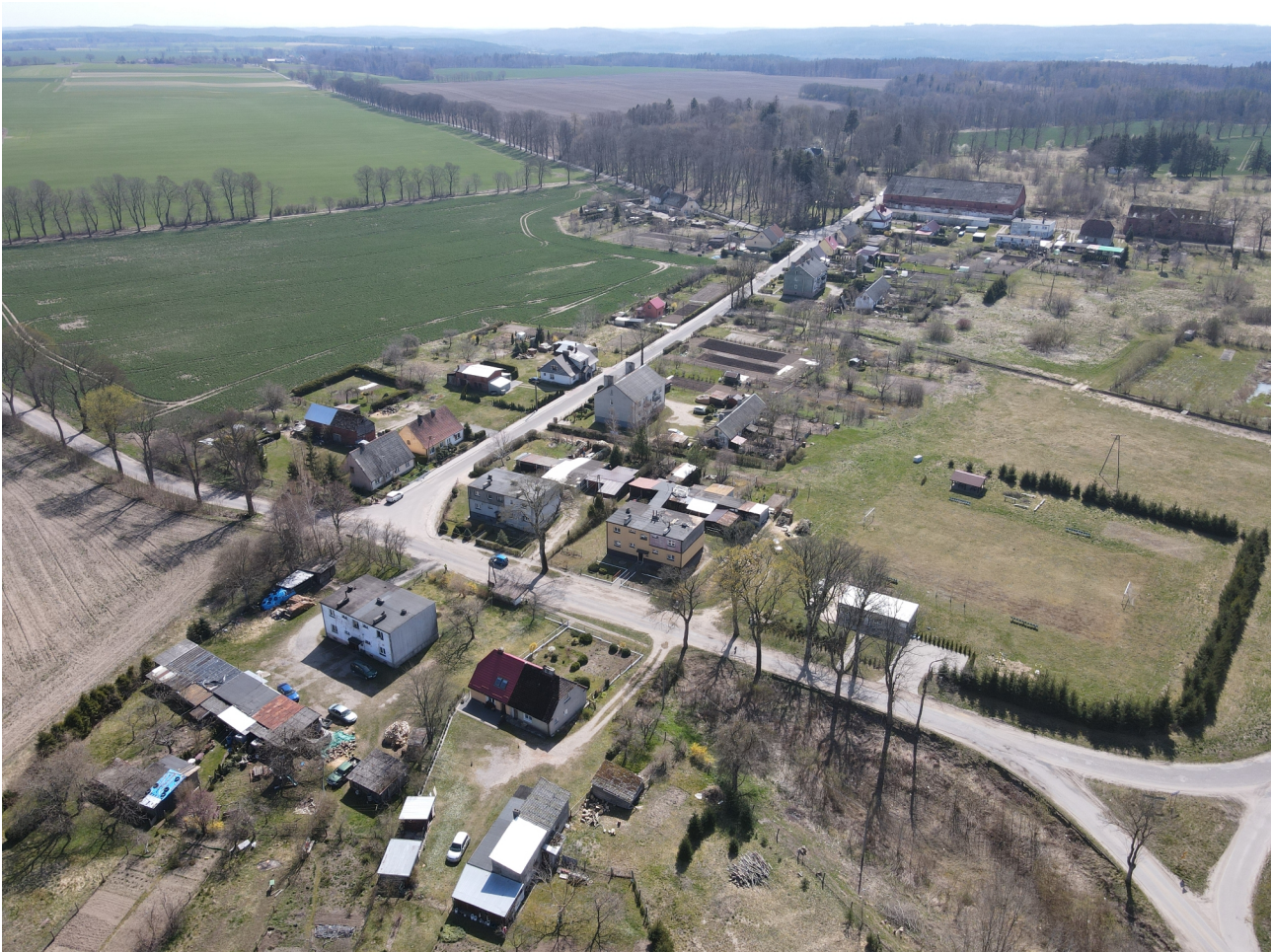
Widok miejscowości z drona.