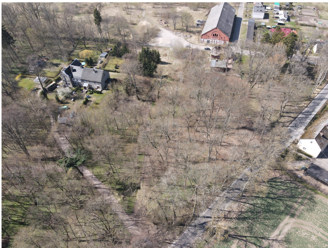
Park dworski wraz z zespołem pałacowym.

powstało Państwowe Gospodarstwo Rolne. 12 lipca 2007 roku miejscowość uzyskała status sołectwa.