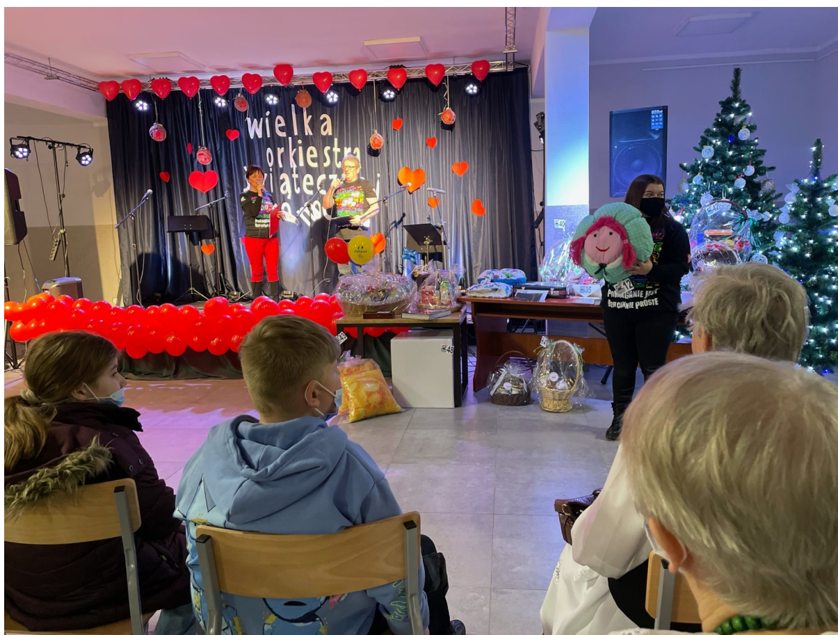
Finiał WOŚP w Gminie Malechowo, 30.01.2022.

Dla mieszkańców organizowane są bezpłatne zajęcia nauki gry na klarncie, saksofonie, trąbce, pianinie, perkusji, zajęcia szachowe, warsztatowe, nauka języka angielskiego, rytmika i próby zespołowe orkiestry. Dzieci uczestniczą w odpłatnych zajęciach breakdance i akrobatyki. Seniorzy biorą udział w zajęciach ruchowych z wykwalifikowanym fizjoterapeutą. W ofercie dla dorosłych jest joga oraz zumba. Ponadto organizowane są projekcje filmów oraz malechowskie spotkania filmowe.