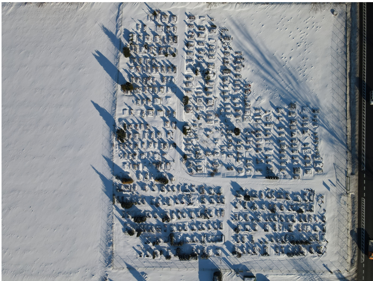
Cmentarz komunalny w Malechowie, 04.02.2022.

Cmentarz jest miejscem wyjątkowym. Stanowi świadectwo historyczne mieszkańców, których już nie ma. Ku pamięci kombatantów wojennych w pobliżu nekropolii ma powstać miejsce pamięci, będące symbolem niepodległości i wolności.