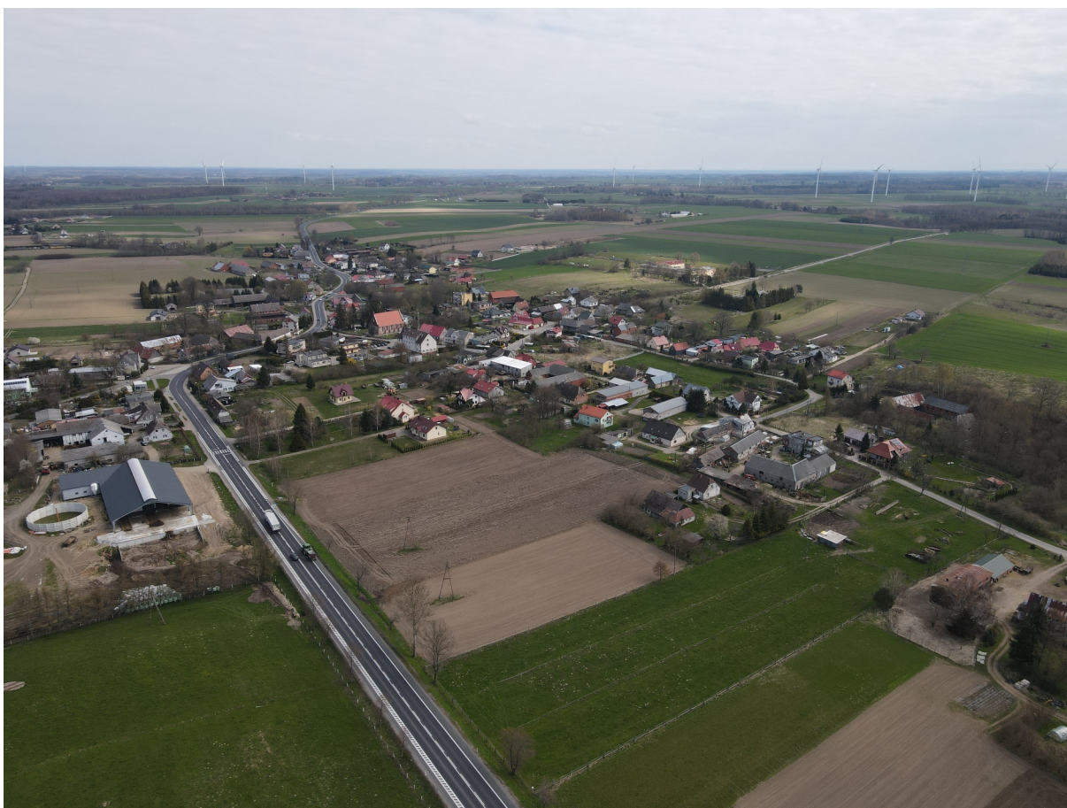
Widok na Malechowo, 28.04.2021.

oraz zabudowa gospodarcza z nieliczną zabudową budynków/bloków wielorodzinnych. W centralnej części wsi znajduje się kościół - murowany z czerwonej cegły, posadowiony na kamiennym fundamencie. Ponadto, w miejscowości przy DK nr 6 usytuowany jest park zwany „Sercem Wsi”, w którym znajdują się dwie wiaty rekreacyjne z ławostołami, wyłożona polbrukiem ścieżka, ławki parkowe oraz pojemniki na odpady. W Malechowie znaleźć można również: budynek Urzędu Gminy, Zakład Opieki Zdrowotnej, Zespół Szkolno-Przedszkolny, restauracje, sklepy, aptekę, siedzibę Ochotniczej Straży Pożarnej, kwaciarnię, bank, oraz siedzibę Gminnej Biblioteki Publicznej.