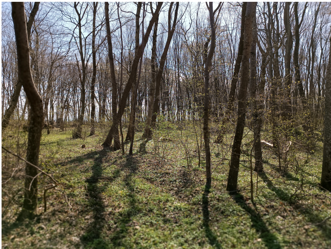
Park dworski w Żegocinie, stan na 22.04.2022.

Drugim niezwykle ważnym miejscem w Żegocinie jest zabytkowy park dworski. Na działkach nr 16/2 i 16/4 znajdują się wieloletnie drzewa i kwitnące kwiaty polne. Niestety miejsce jest zaniedbane i wymaga interwencji mieszkańców oraz środków finansowych by je odrestaurować lub nadać mu nową funkcję.