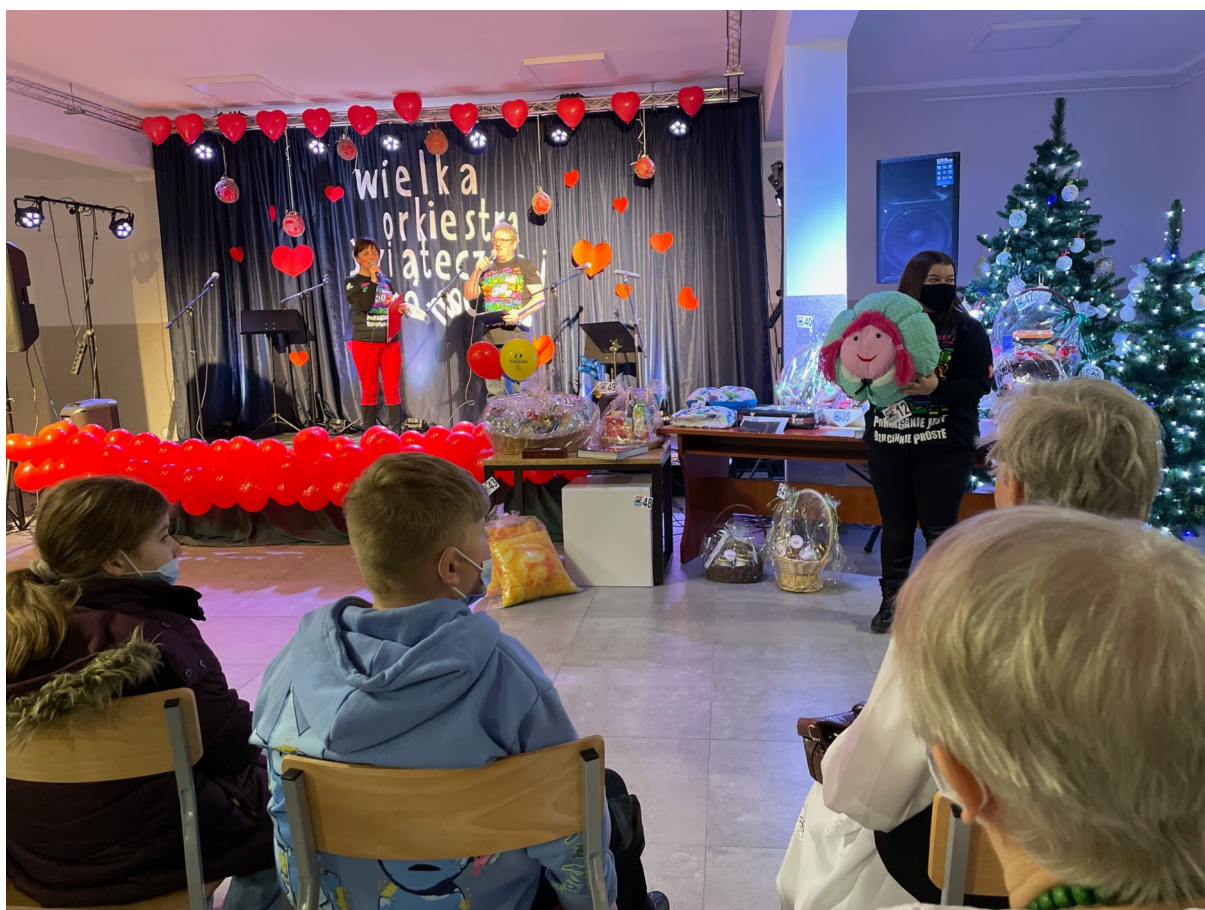
Finiał WOŚP w Gminie Malechowo, 30.01.2022.

Dla mieszkańców organizowane są bezpłatne zajęcia nauki gry na klarncie, saksofonie, trąbce, pianinie, perkusji, zajęcia szachowe, warsztatowe, nauka języka angielskiego, rytmika i próby zespołowe orkiestry. Dzieci uczestniczą w odpłatnych zajęciach breakdance i akrobatyki. Seniorzy biorą udział w zajęciach ruchowych z wykwalifikowanym fizjoterapeutą. W ofercie dla dorosłych jest joga oraz zumba. Ponadto organizowane są projekcje filmów oraz malechowskie spotkania filmowe.