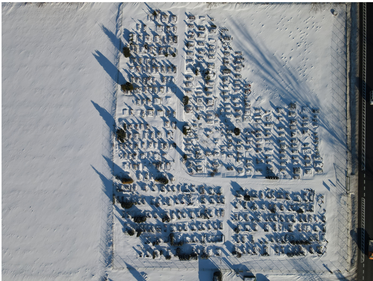
Cmentarz komunalny w Malechowie, 04.02.2022.

Cmentarz jest miejscem wyjątkowym. Stanowi świadectwo historyczne mieszkańców, których już nie ma. Ku pamięci kombatantów wojennych w pobliżu nekropolii ma powstać miejsce pamięci, będące symbolem niepodległości i wolności.