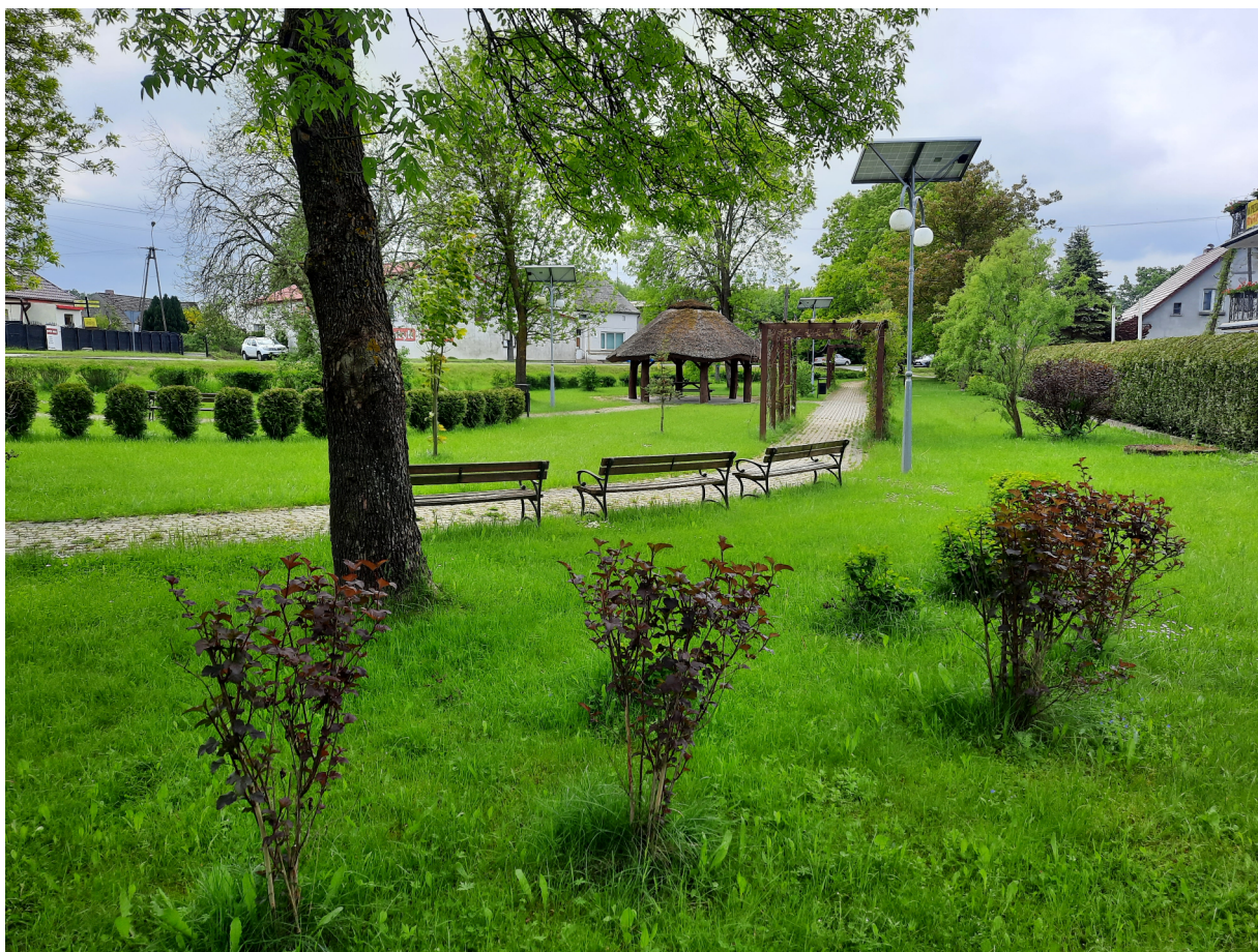
Serce Wsi w Malechowie.

Za budynkiem Urzędu Gminy na działce numer 556 znajduje się strefa rekreacji, z której korzystali mieszkańcy podczas wydarzeń sołeckich oraz gminnych. Jednak od kilku lat miejsce jest nieużytkowane. W tym roku powstanie tu parking dla klientów Urzędu Gminy, a elementy zabawowe dla dzieci zostaną przeniesione w inne miejsce.