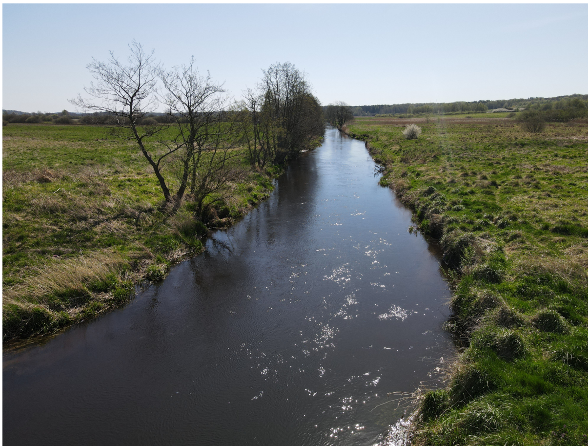
Rzeka Grabowa.

a przez jej zachodnią część przepływa rzeka Grabowa, która jest rajem dla kajakarzy, wędkarzy i miłośników przyrody.