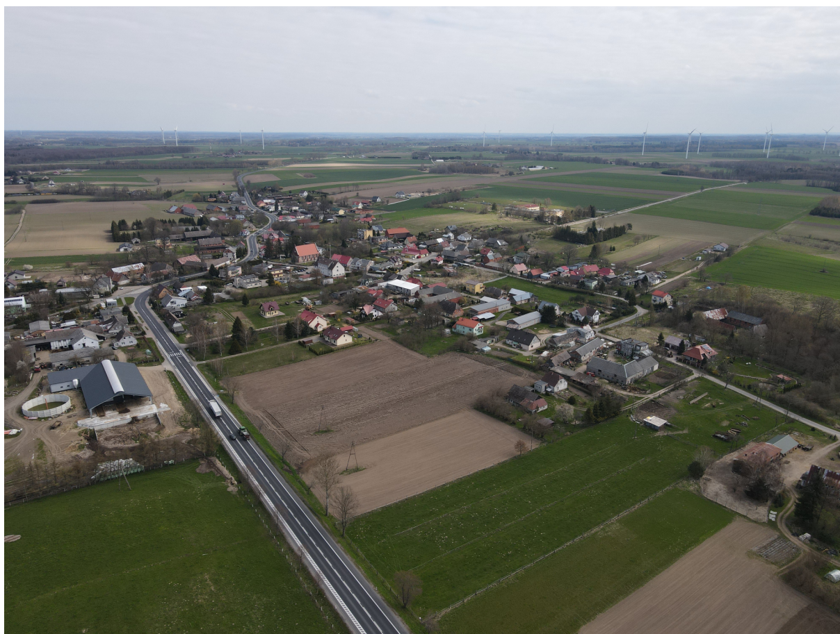
Widok na Malechowo, 28.04.2021.

oraz zabudowa gospodarcza z nieliczną zabudową budynków/bloków wielorodzinnych. W centralnej części wsi znajduje się kościół - murowany z czerwonej cegły, posadowiony na kamiennym fundamencie. Ponadto, w miejscowości przy DK nr 6 usytuowany jest park zwany „Sercem Wsi”, w którym znajdują się dwie wiaty rekreacyjne z ławostołami, wyłożona polbrukiem ścieżka, ławki parkowe oraz pojemniki na odpady. W Malechowie znaleźć można również: budynek Urzędu Gminy, Zakład Opieki Zdrowotnej, Zespół Szkolno-Przedszkolny, restauracje, sklepy, aptekę, siedzibę Ochotniczej Straży Pożarnej, kwaciarnię, bank, oraz siedzibę Gminnej Biblioteki Publicznej.