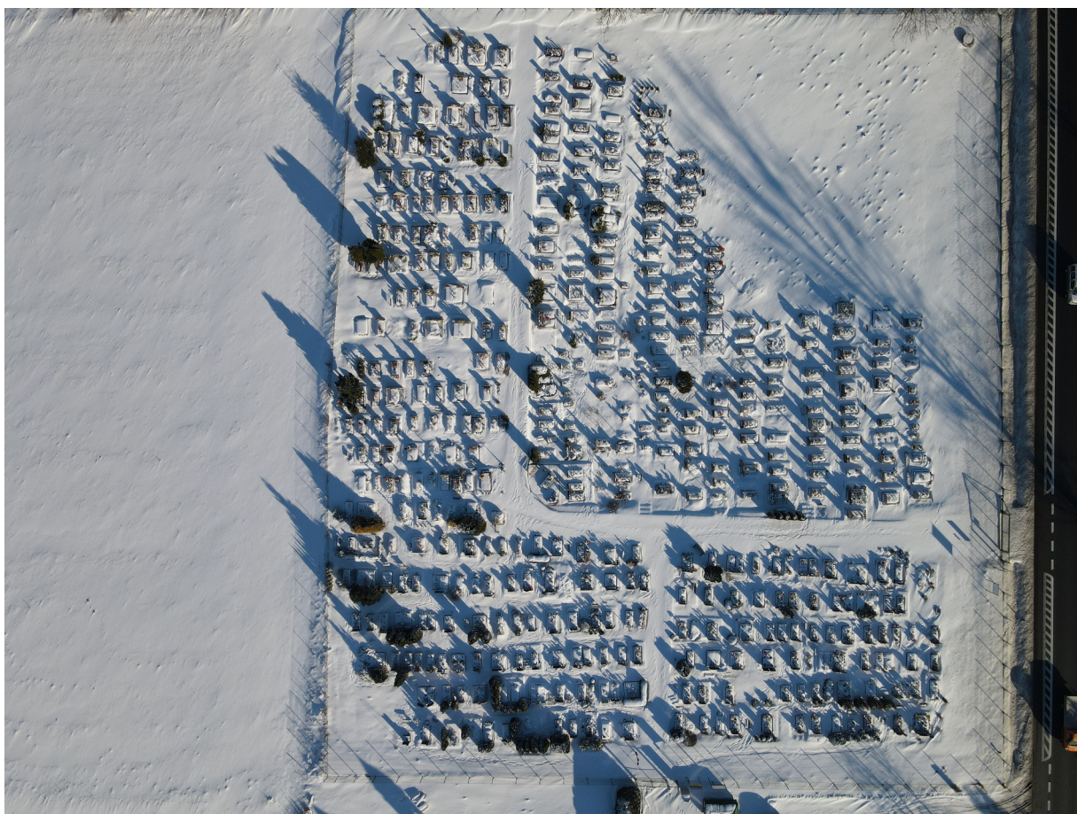
Cmentarz komunalny w Malechowie, 04.02.2022.

Cmentarz jest miejscem wyjątkowym. Stanowi świadectwo historyczne mieszkańców, których już nie ma. Ku pamięci kombatantów wojennych w pobliżu nekropolii ma powstać miejsce pamięci, będące symbolem niepodległości i wolności.