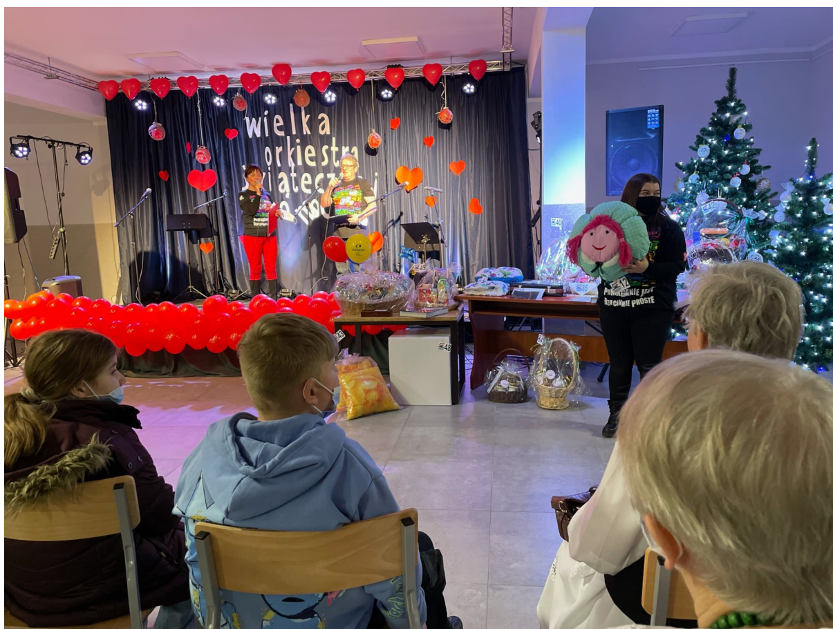
Finat WOŚP w Gminie Malechowo, 30.01.2022.

Dla mieszkańców organizowane są bezpłatne zajęcia nauki gry na klarncie, saksofonie, trąbce, pianinie, perkusji, zajęcia szachowe, warsztatowe, nauka języka angielskiego, rytmika i próby zespołowe orkiestry. Dzieci uczestniczą w odpłatnych zajęciach breakdance i akrobatyki. Seniorzy biorą udział w zajęciach ruchowych z wykwalifikowanym fizjoterapeutą. W ofercie dla dorosłych jest joga oraz zumba. Ponadto organizowane są projekcje filmów oraz malechowskie spotkania filmowe.