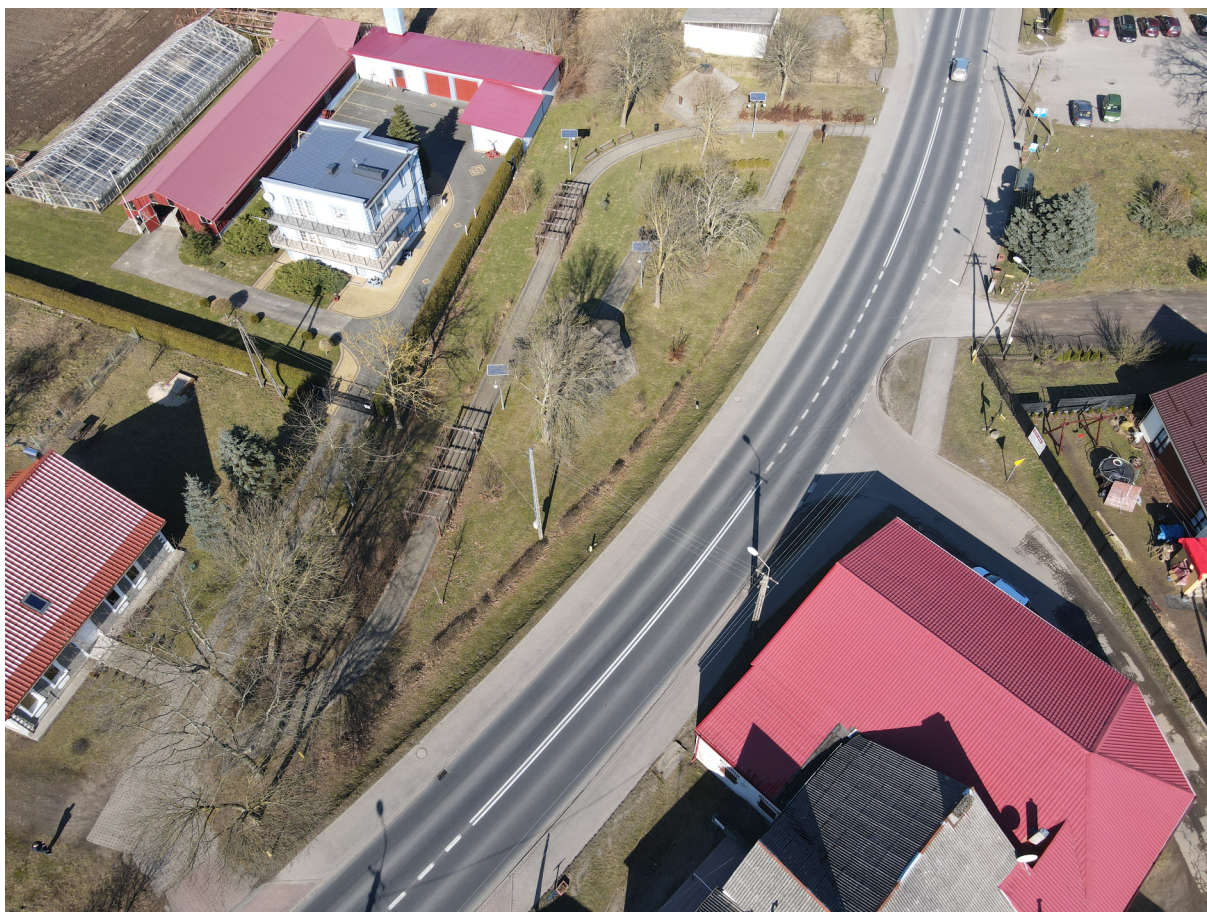
Serce wsi w Malechowie, ujęcie z drona.

Serce wsi w Malechowie ma szczególną wartość dla mieszkańców. Znajduje się w centrum miejscowości, dzięki czemu z każdego punktu jest „po drodze”. Stanowi świetne zaplecze do realizacji projektów animacyjnych oraz małych projektów inwestycyjnych. W ostatnim czasie OSP w Malechowie zrealizowała projekt EkoReanimacja Serca Wsi w Malechowie, podczas którego uporządkowano cały teren i dokonano nowych nasadzeń. Obiekt wymaga dużych nakładów finansowych, ale też zaangażowania mieszkańców w dbanie o porządek. Miejsce ma potencjał, by stać się wyjątkowym ośrodkiem rekreacyjno-kulturalnym, zwłaszcza że w sąsiedztwie znajduje się siedziba Gminnej Biblioteki Publicznej. Wydarzenia tam organizowane mogą być wyjątkowe na skalę regionu.