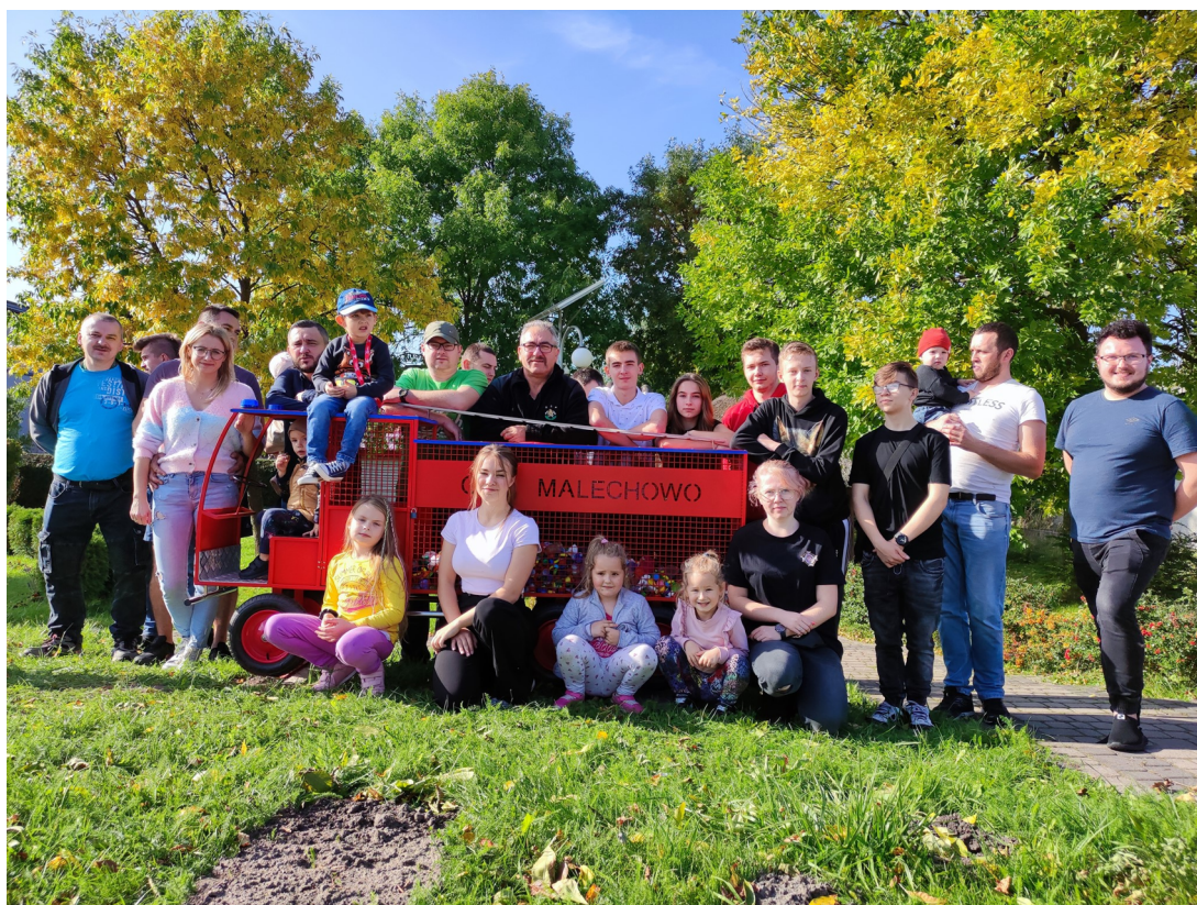
13 Finale projektu EkoReanimacja Serca Wsi w Malechowie realizowanego przez OSP.

Na wyróżnienie zasługuje zaangażowanie organizacji pozarządowych w życie społeczne i kulturalne wsi. Członkowie stowarzyszeń z sukcesami piszą wnioski do programów tj. Społecznik, Mikrodotacje, Działaj Lokalnie, Granty Strażackie czy programy organizowane przez ŚGD, dzięki czemu wizerunek Malechowa uległ znaczącej poprawie. Dużym wsparciem dla lokalnej społeczności jest Klub Seniora, który zrzesza osoby starsze z Malechowa i Gorzycy. Członkowie klubu biorą udział w wycieczkach, spotkaniach autorskich, wydarzeniach plenerowych i artystycznych.