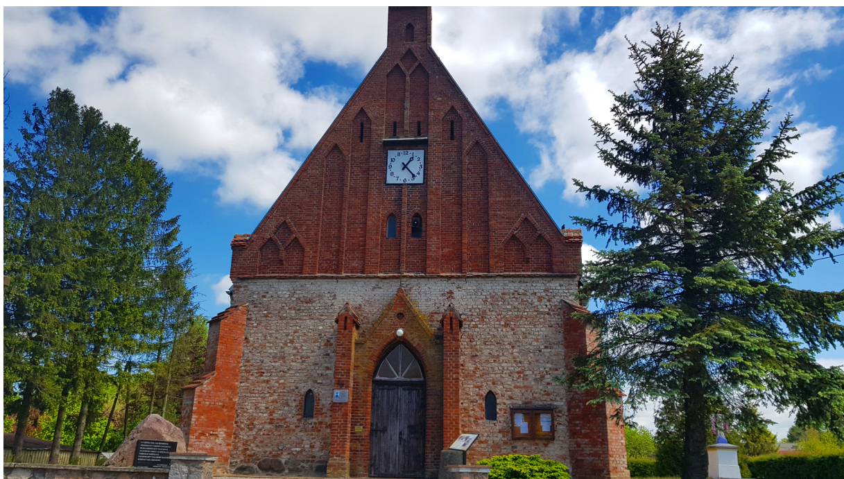
Kościół pw. Matki Bożej Gromniczej w Malechowie.

W końcu XIX wieku ewangelicki cmentarz zbudowano za wsią przy drodze do Pękanina. On również został wpisany do Ewidencji Zabytków Narodowego Instytutu Dziedzictwa pod numerem PL.1.9.ZIPOZ.NID_E_32_CM.66207. W latach 60-tych powstał w tym miejscu cmentarz komunalny, który funkcjonuje do dziś. Z dawnej zabudowy zachował się jedynie cokół i krzyż z nagrobka dziecięcego.