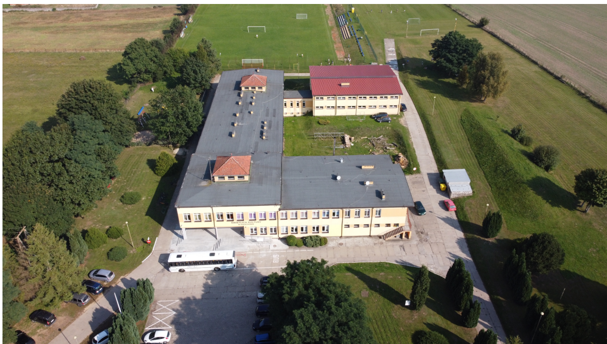
ZSP w Malechowie, Świetlica Kultury oraz tereny rekreacyjno-sportowe.

Na terenie Malechowa funkcjonuje szereg instytucji społecznych, które pełnią zróżnicowaną rolę w życiu lokalnym. Dzieci uczęszczają do Zespołu Szkolno – Przedszkolnego w Malechowie, którego bogata infrastruktura pozwala na kształcenie na wysokim poziomie. Na terenie obiektu znajduje się również Świetlica Kultury, w której uczniowie mogą korzystać z zajęć artystycznych i edukacyjnych z wykorzystaniem nowych technologii. Przy szkole funkcjonują boiska sportowe, elementy siłowni zewnętrznej oraz plenerowe gry i zabawy. Organizowane są zajęcia instrumentalne (gitara, perkusja, saksofon lub trąbka), joga, gimnastyka rehabilitacyjna dla seniorów, koncerty, spotkania autorskie i wystawy. W ciągu roku odbywa się wiele wydarzeń plenerowych tj. festyny rodzinne, festyny charytatywne, kino plenerowe, zbiórki krwi, dożynki, imprezy sportowe, tematyczne i rekreacyjne. Niezwykle ważnym elementem rozwoju kulturalnego mieszkańców wsi jest Gminna Biblioteka Publiczna, która z zaangażowaniem włącza się w organizację wydarzeń, a także zajmuje się prowadzeniem autorskich projektów animacyjnych, czytelniczych i twórczych. W budynku Urzędu Gminy Malechowo znajduje się również Gminny Ośrodek Pomocy Społecznej, którego celem jest pomoc najuboższym mieszkańcom gminy. GOPS sprawuje również opiekę nad Placówkami Wsparcia Dziennego. Mieszkańcy apelują o utworzenie punktu żłobkowego.